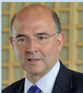
Pierre MOSCOVICI Ministre de l'Économie et des Finances

Nous vous prions d'agréer, Madame, Monsieur, l'expression de notre considération très distinguée.