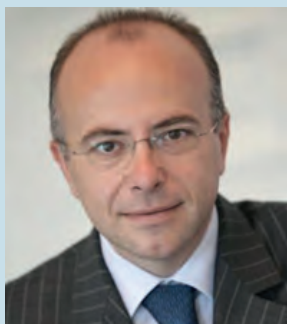
Bernard CAZENEUVE Ministre délégué auprès du ministre de l'Économie et des Finances, chargé du Budget