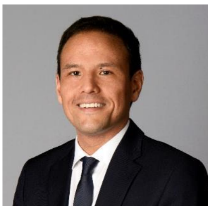
Cédric O, secrétaire d'Etat chargé de la Transition numérique et des Communications électroniques

Pour accompagner la relance de son économie, la France doit investir dans les innovations qui contribueront demain à sa compétitivité. La 5G et les futures technologies de réseaux de télécommunications en font partie.