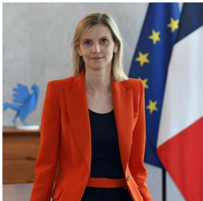
Agnès Pannier-Runacher, ministre déléguée auprès du ministre de l'Économie, des Finances et de la Relance, chargée de l'Industrie