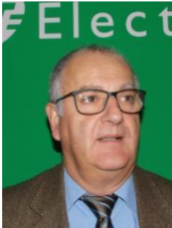
Purchasing Manager – Médiateur & correspondant PME auprès des fournisseurs