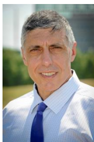
Président de SD2M