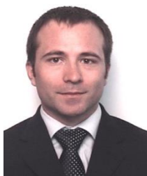
Contrôleur de Gestion Achats Groupe