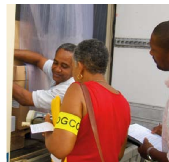
Contrôle routier aux Antilles