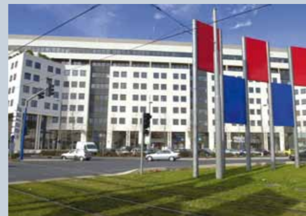
Bâtiment de l'ENCCRF à Montpellier

I-III-3-L'école de la DGCCRF devra s'attacher à développer un haut niveau de formation permettant un exercice optimal des missions sur l'ensemble du territoire, et répondre aux nouvelles problématiques de concurrence ou de consommation. Elle devra organiser une réponse adaptée aux besoins exprimés localement, pour permettre à la fois d'adapter les formations aux besoins au niveau régional, et une démultiplication des actions de formation, sur une base commune.