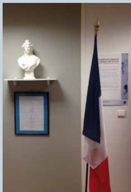
Locaux de l'école

L'École nationale de la concurrence, de la consommation et de la répression des fraudes (ENCCRF) est chargée du recrutement et de la formation des agents de la concurrence, de la consommation et de la répression des fraudes et des personnels des laboratoires des ministères économiques et financiers. L'école assure aussi la documentation des agents CCRF et participe à l'information des consommateurs et des professionnels avec Info Service Consommation. L'école s'appuie sur une équipe de formateurs permanents et un réseau étendu de formateurs associés, des agents de terrain ainsi que des universitaires, économistes, comptables, scientifiques, des professionnels du droit, des représentants d'institutions nationales ou communautaires. Tous animés par la volonté de diffuser connaissances et compétences techniques, leur objectif en formation initiale est de former des enquêteurs. Par leur action en formation continue, ils contribuent à l'entretien et au développement des savoirs et compétences de tous les agents.