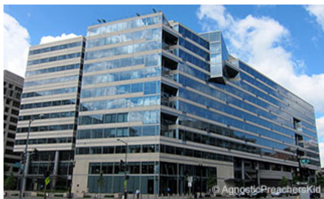
Le siège no 2 du FMI à Washington D.C.

Les instruments spécifiques au secteur public visés dans ce document sont la monnaie en circulation et les actifs de réserve des autorités monétaires tels que le stock d'or et les actifs résultant des droits de tirage spéciaux du Fonds Monétaire International.