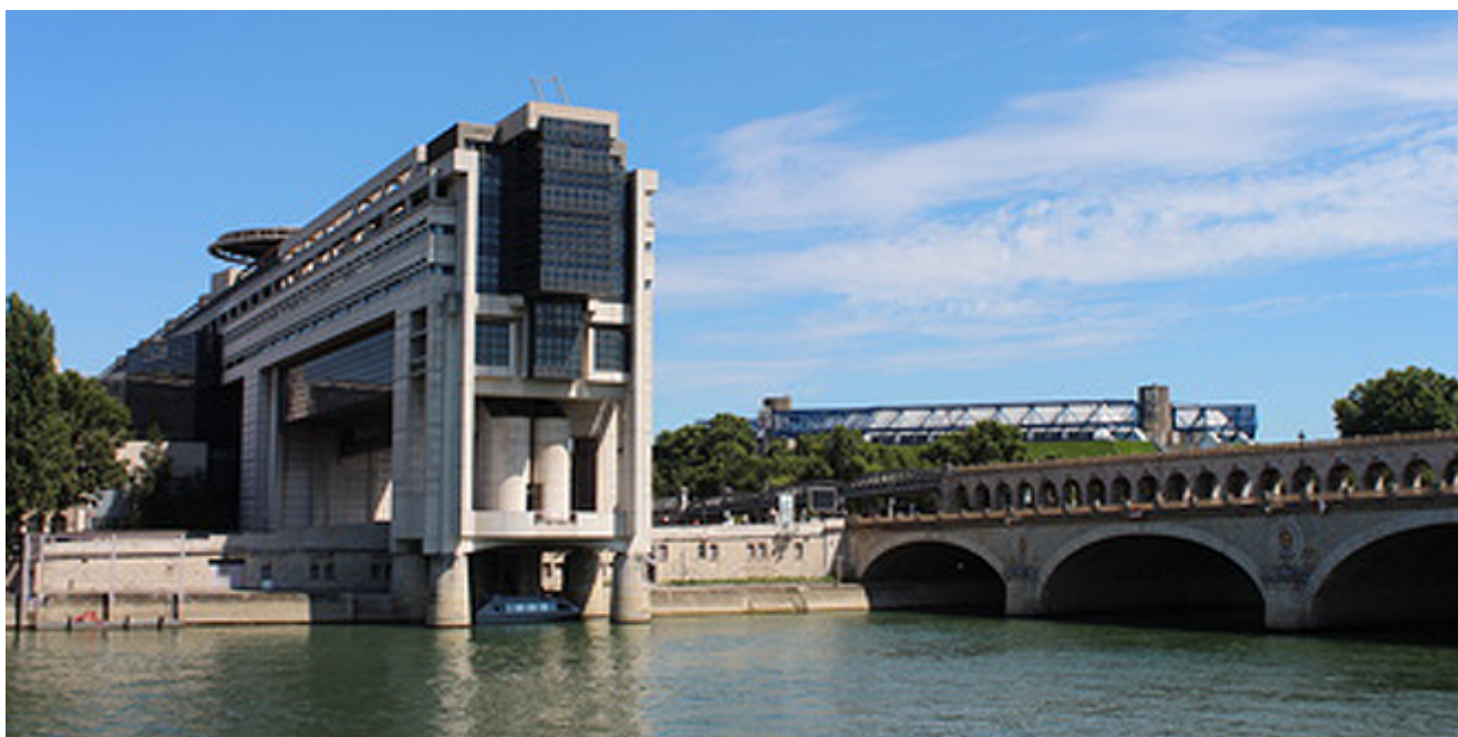
Ministère des Finances, Bercy - Paris

Un nouvel arrêté portant modification des règles applicables à la comptabilité générale de l'État a été signé le 18 janvier 2016 par le Ministre des finances et des comptes publics et le Secrétaire d'État chargé du budget, et publié au Journal officiel le 27 janvier 2016