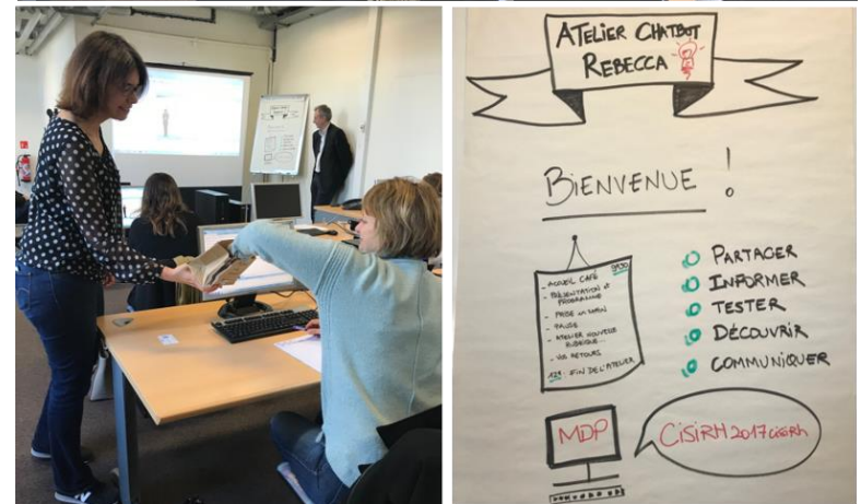
Atelier utilisateurs « Rebecca »