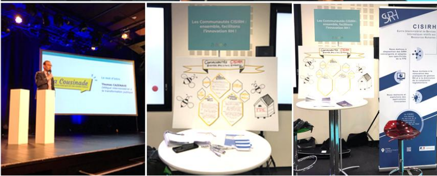
Participation des communautés du CISIRH à « La Cousinade »