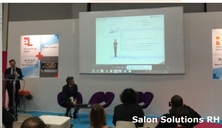
Salon Solutions RH