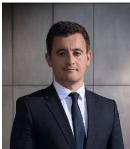
Gérald DARMANIN Ministre de l'Action et des Comptes publics

Depuis plus de deux ans et demi, le contrôle fiscal a engagé une transformation en profondeur de son organisation, de ses outils et de ses méthodes.