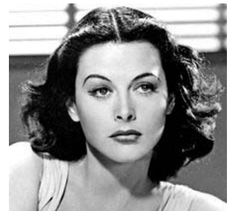
Hedy Lamarr (1914 – 2000) est considérée comme l'inventeuse du GPS