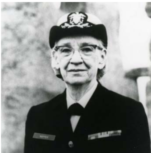
Grace Hopper (1906 – 1992) a conçu le premier langage de programmation