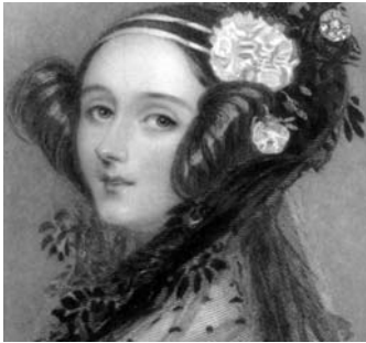
Ada Lovelace (1815 – 1852) a créé le 1 er programme informatique