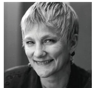
Anita Borg (1949 – 2003) a imaginé un système permettant d'analyser des systèmes mémoriels à haute vitesse