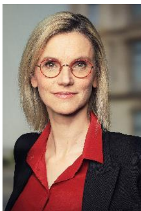
Agnès Pannier-Runacher Ministre de la Transition énergétique