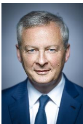
Bruno Le Maire Ministre de l'Économie, des Finances et de la Souveraineté industrielle et numérique