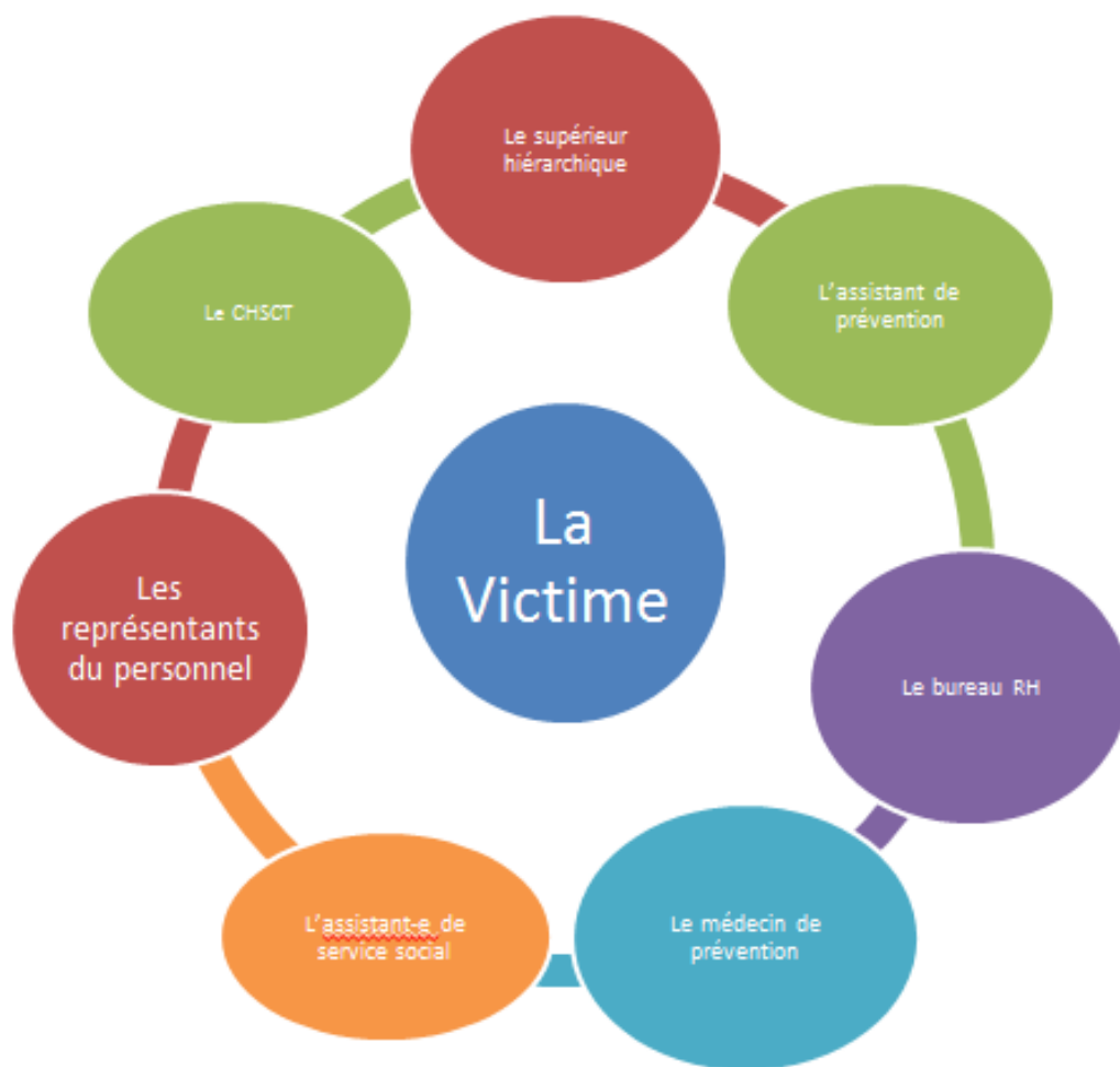
Schéma des intervenants qui peuvent être sollicités dans une situation de violence sexiste ou sexuelle.