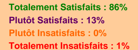
Table Ronde 2